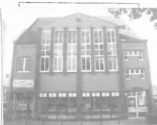
Hausansicht vom Marktplatz Mari-Hüls

Anlass der Ausstellung des Energieausweises